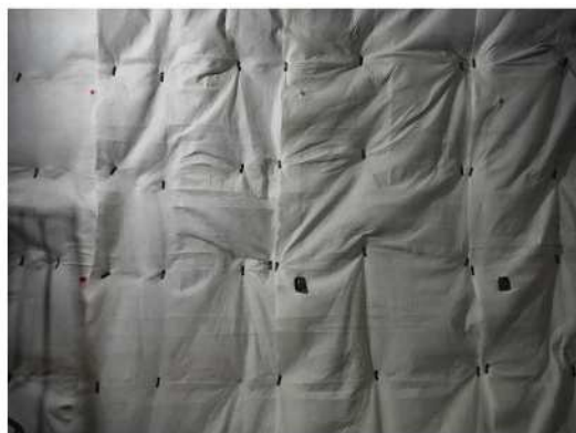
①吹付面へ不織布取付