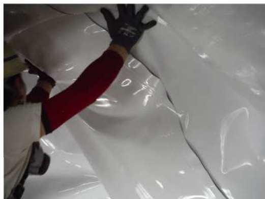
④面ファスナー取付状況