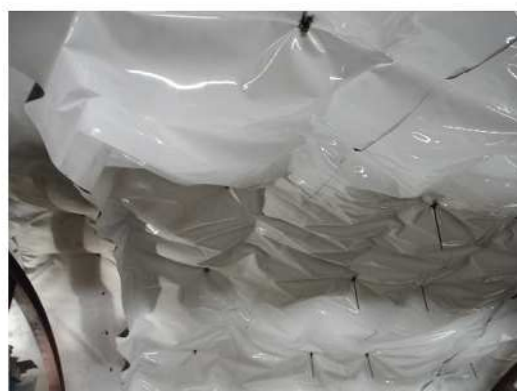
⑤防水シート設置終了