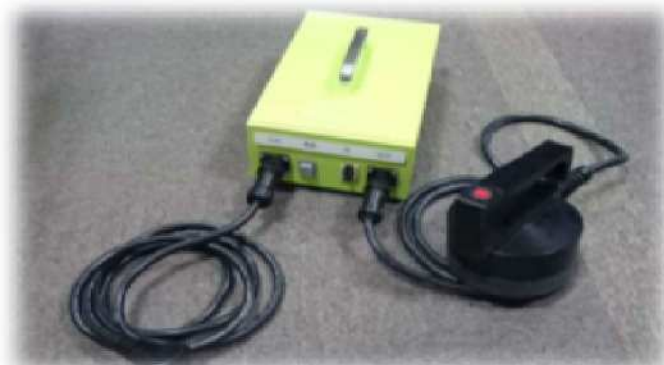
●IH ディスクウェルダ