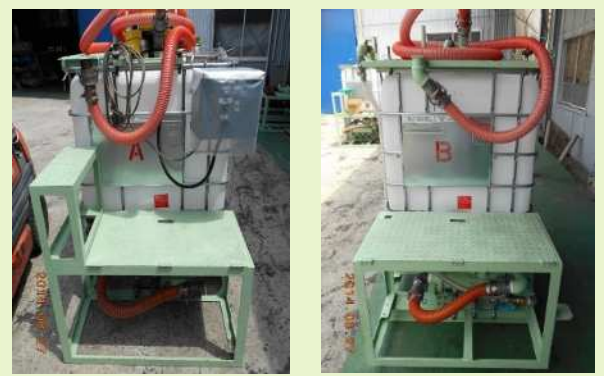
【エコバルク：注入材コンテナタンク】