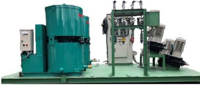
《流量計付ポンプユニット》